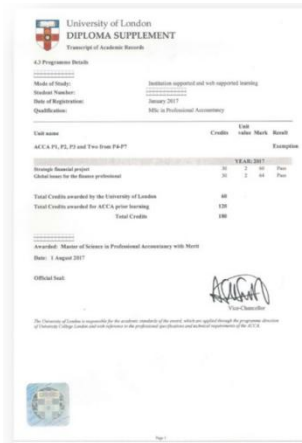
英国伦敦大学硕士学位证书