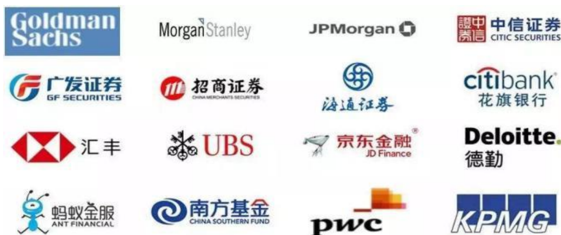
( CFA&FRM 全球十六佳雇主 )

CFA&FRM是企业高薪招聘与培养的精英人才。国内外大型金融机构在招聘相关岗位时都明确标明“CFA/FRM持证者优先”，双持证人几乎可以覆盖整个金融行业，同时又聚集在顶尖的行业岗位，如投资银行分析师、基金经理、研究分析师、策略师、风控经理、风险科技业者、风险顾问业者、企业财务分析师、高级咨询经理、首席级高管、财务顾问、会计师、审计师等。